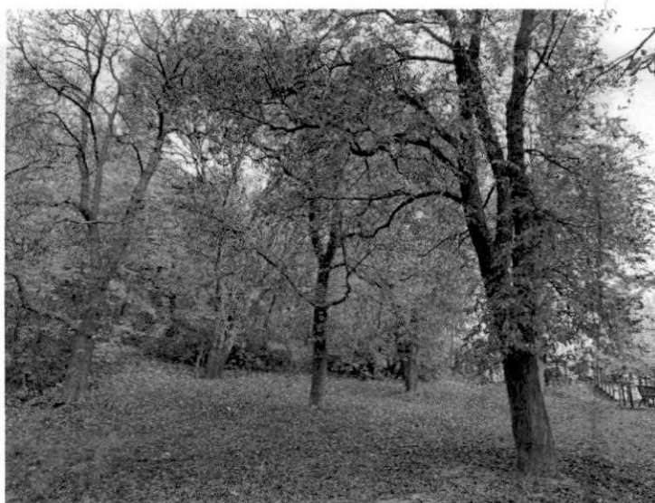
Fot.2. Widok na istniejący drzewostan.