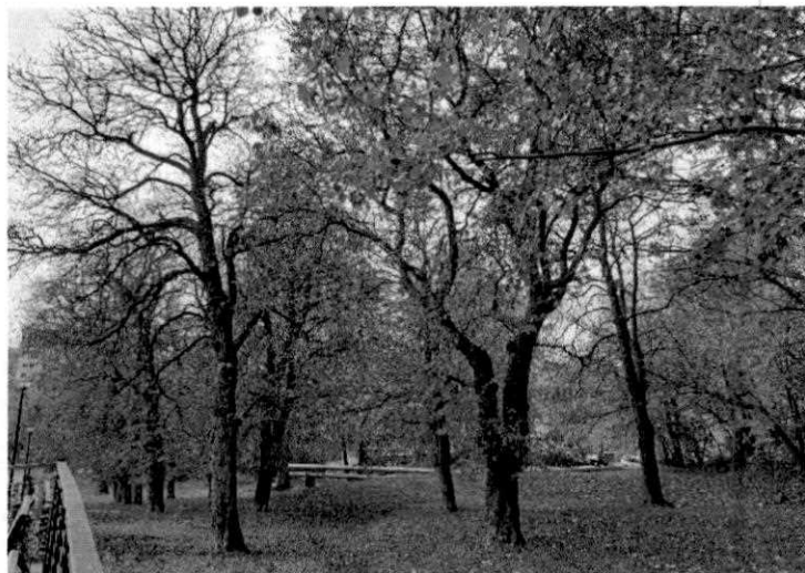
Fot.1. Widok na istniejący drzewostan.