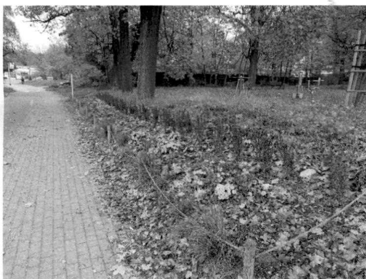
Fot.3. Widok na istniejące nasadzenia roślin – cisy, trawy ozdobne.