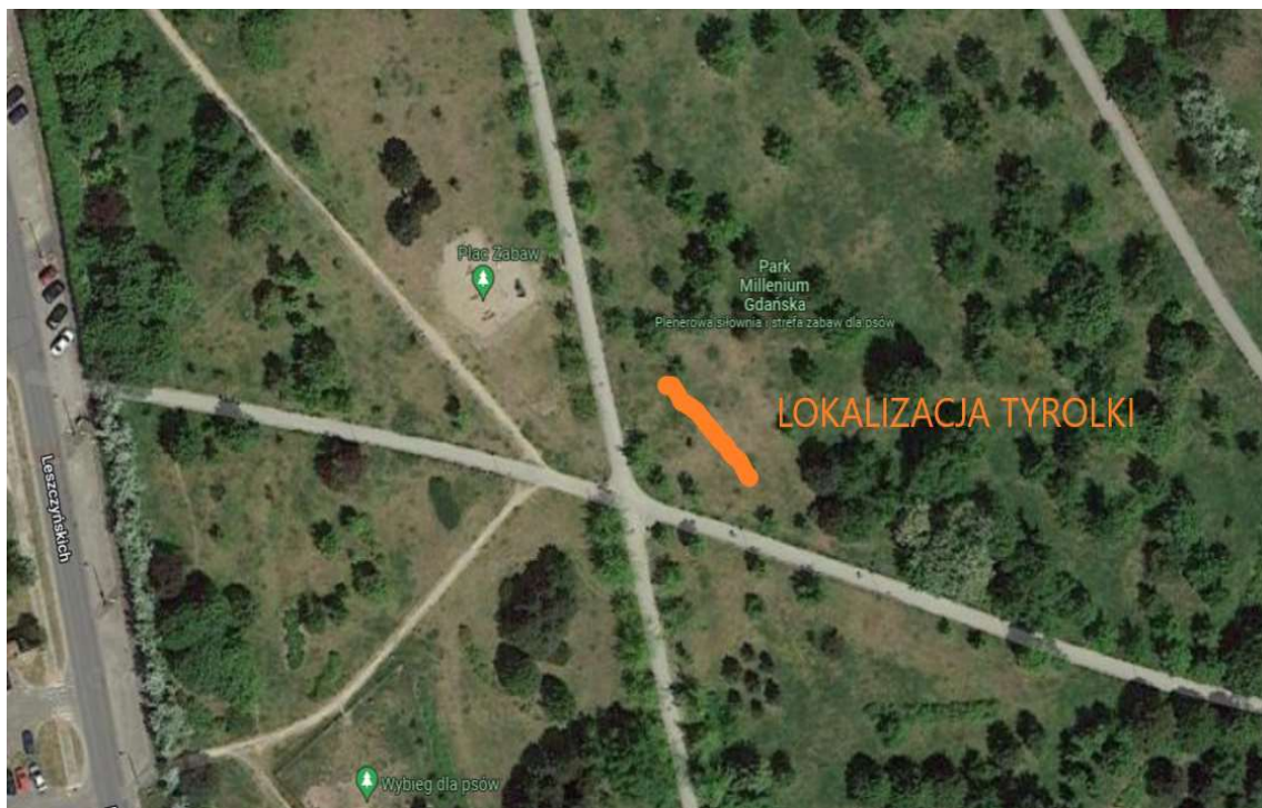
Lokalizacja – stan istniejący, działka nr 277/2 obręb 033 w Gdańsku

Zamówienie obejmuje zagospodarowanie fragmentu działki nr 277/2 obręb 033 położonej w Gdańsku w Parku Millenium Gdańska, teren jest własnością Gminy Miasta Gdańska. Obecnie do elementów zagospodarowania terenu w obszarze opracowania należą istniejące drzewa stanowiące naturalne elementy zagospodarowania parku oraz alejki parkowe, plac zabaw dla dzieci oraz wybieg dla psów.