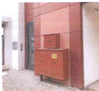
ul. Chmielna, Gdańsk

W przypadku lokalizacji szafki przy elewacji, ogrodzeniu bądź innych elementach o określonej kolorystyce, zaleca się malowanie szafki w kolorze sąsiadującego obiektu. Dopuszcza się także, za zgodą gestora sieci, wykorzystanie szafki pod kompozycję graficzną niebędącą reklamą, zaakceptowaną przez GZDiZ. Poniżej przykłady tego typu maskowania.