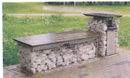
Ogród Doświadczeń im. Stanisława Lema, Kraków