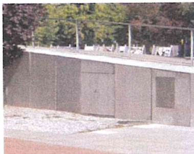
Muzeum Przełomy, Szczecin