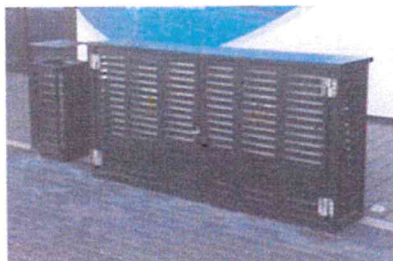
ul. Nabrzeże Prezydenta, Gdynia