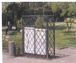
ul. Chopina, Sopot