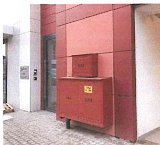
ul. Chmielna, Gdańsk

W przypadku lokalizacji szafki przy elewacji, ogrodzeniu bądź innych elementach o określonej kolorystyce, zaleca się malowanie szafki w kolorze sąsiadującego obiektu. Dopuszcza się także, za zgodą gestora sieci, wykorzystanie szafki pod kompozycję graficzną niebędącą reklamą, zaakceptowaną przez GZDiZ. Poniżej przykłady tego typu maskowania.