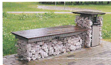
Ogród Doświadczeń im. Stanisława Lema, Kraków