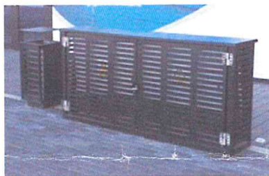
ul. Nabrzeże Prezydenta, Gdynia