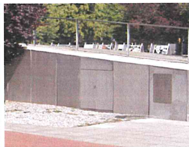
Muzeum Przełomy, Szczecin