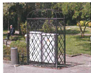
ul. Chopina, Sopot