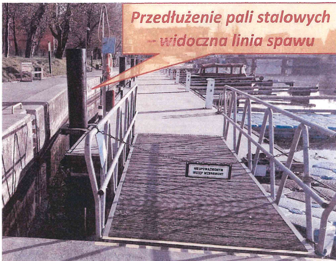
Foto nr 1 - pale stalowe