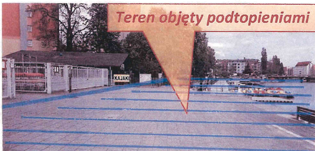
Foto nr 2 - wizualizacja