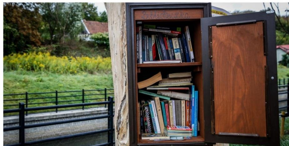
BIBLIOTECZKA PLENEROWA - DRZEWO - miejsce wymiany książek.