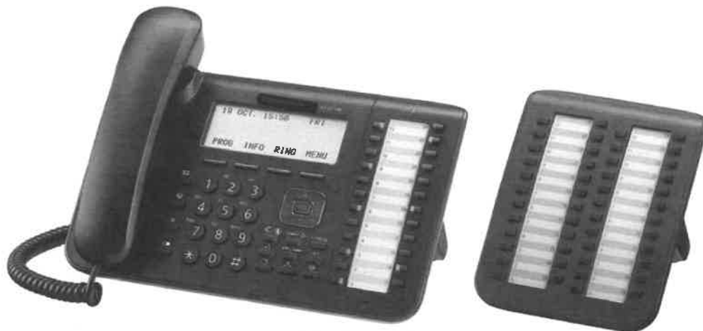
Rys 2. Aparat systemowy z konsolą ( 3 szt w projekcie )