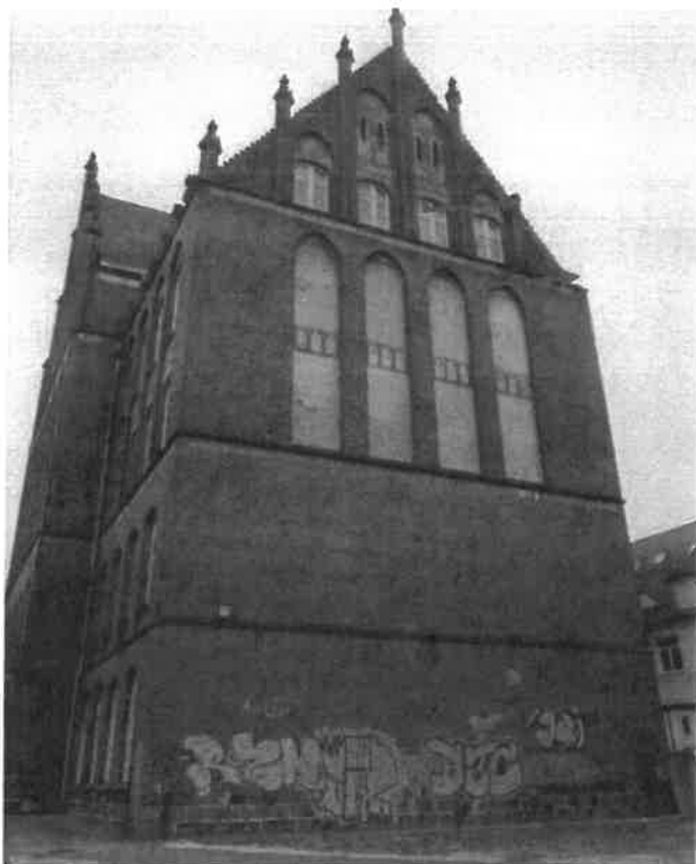
Ściana szczytowa północna – wieżyczka remontu i odtworzenia.