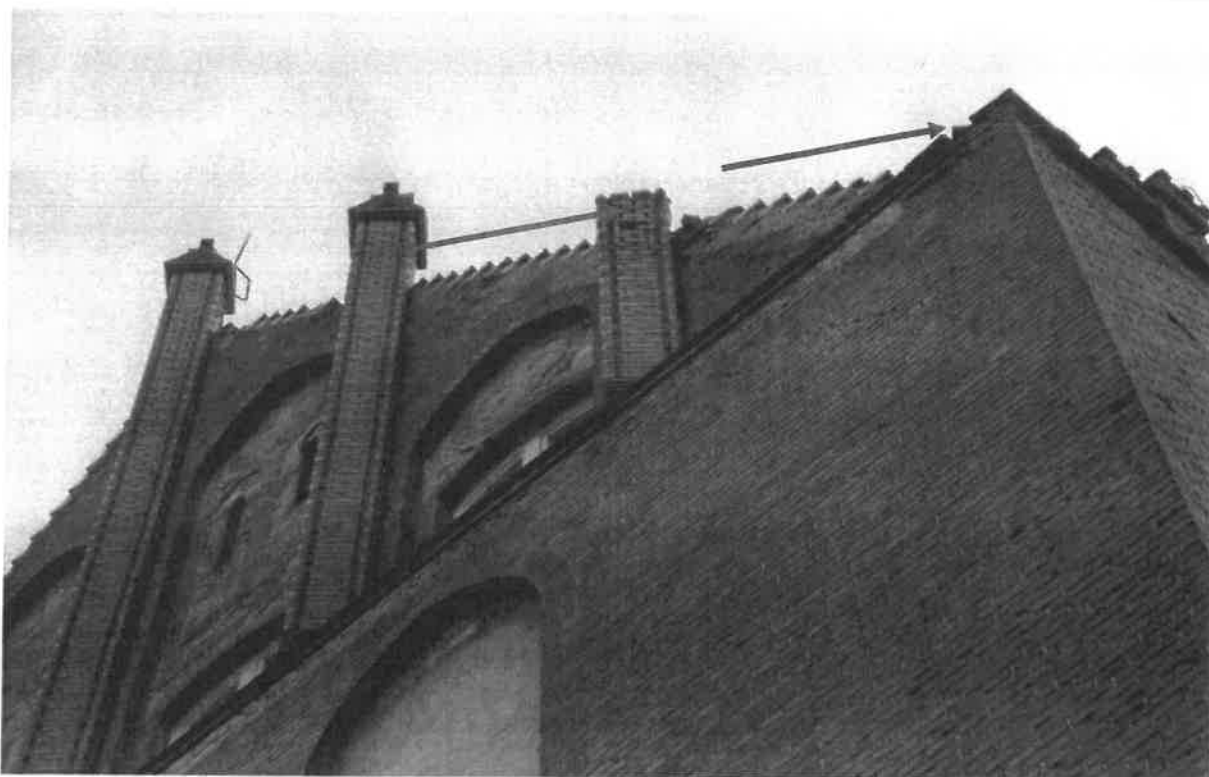
Luźne cegły w koronie wieżyczki. Narożnik ściany w którym należy odtworzyć wieżyczkę