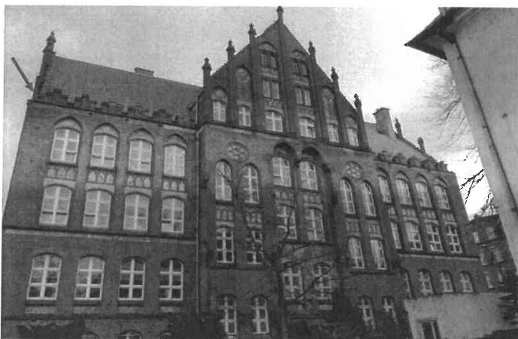
Fronton wschodni – brakująca wieżyczka

Wieżyczki ceglane usytuowane na ścianach szczytowych i frontonach wykończone ceglami glazurowanymi – profilowaną stróżką. Wierzchołek zakończony ceramicznym kwiatonem. Wieżyczki szt. 2 w szczycie ściany Pn będące w złym stanie technicznym należy odbudować i przywrócić do pierwotnego wyglądu. Luźne cegły leżące w ostatnich warstwach słupków stwarzają zagrożenie dla przechodniów i uczniów szkoły. Ponadto wypłukane spoiny w murach – (zwieńczenie ścian skośnych) w znacznym stopniu osłabiają ich wytrzymałość. Wieżyczki należy odtworzyć stosując kształtki ceramiczne identyczne jak istniejące z zachowaniem kolorystyki elementów glazurowanych. Wieżyczki należy powiązać z ścianami. Wtórne wykonanie fragmentu wieżyczki na ścianie południowej należy rozebrać i wymurować ponownie z zachowaniem historycznego wyglądu. Równocześnie należy przemurować brakującą część sklepienia nad oknem oraz uzupełnić fragment ściany szczytowej wraz z kształtkami ceramicznymi. Wypłukane spoiny należy uzupełnić zaprawą wapienna.